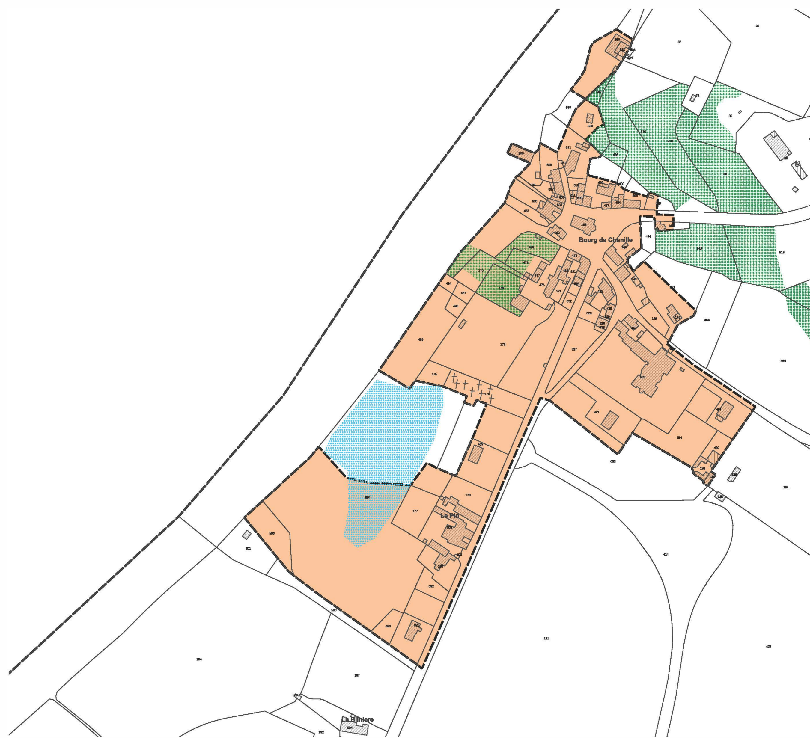
Echelle : 1/2000 ème Bourg de Chenillé