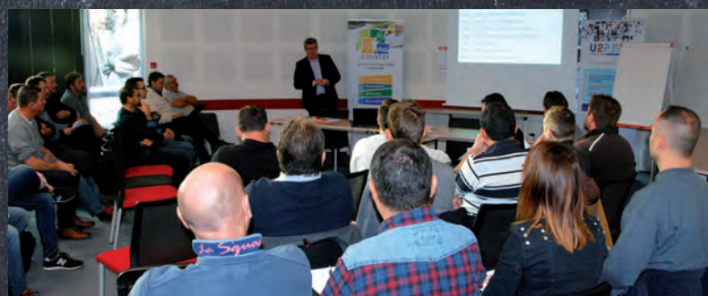
La Communauté de communes a pris part à sa première réunion annuelle, en tant que nouveau membre, le jeudi 7 novembre 2019, au sein de la Chambre nationale de l'artisanat des travaux publics (CNATP).

L'engagement des installateurs, des bureaux d'étude, des SPANC et des vidangeurs a pour objectifs :