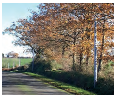
Situation empêchant tout déploiement