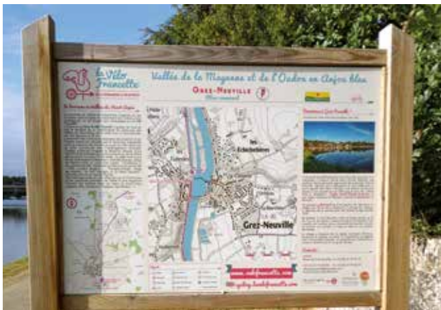
Le panneau Vélo Francette® installé à Grez-Neuville.

Le coût du projet est de 4 618,20 € TTC.